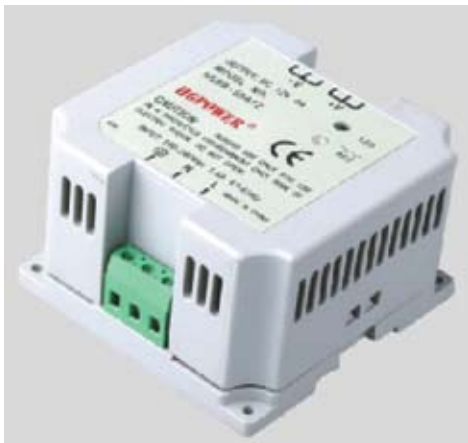
Рис. 2. Источник питания серии HGDR

дает представление о внешнем виде выпускаемых серий.