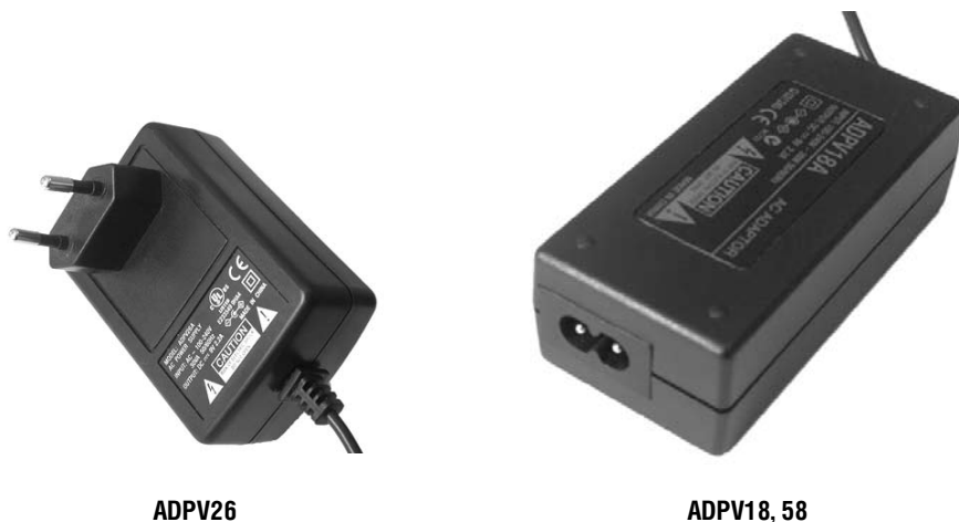
Рис. 1. Внешний вид сетевых адаптеров HGPower

Корпуса адаптеров цельнолитые, выполнены из пластика ABC и вполне узнаваемы по форме. В корпусах одного форм-фактора выполнены различные варианты сетевых вилок. Рисунок 1