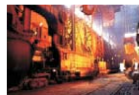
Рис. 1. Некоторые области применения высокотемпературных компонентов TI

Промышленность: - химические процессы - датчики и системы управления