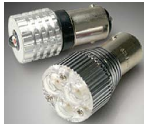
Рис. 1. Лампы стоп-сигнала и двухнитевые лампы «стоп-сигнал – поворот»

Уровень тока, протекающего через светодиоды, задается одним внешним резистором. Микросхема доступна в корпусах SOIC, TSSOP, QSOIP и TQFN.