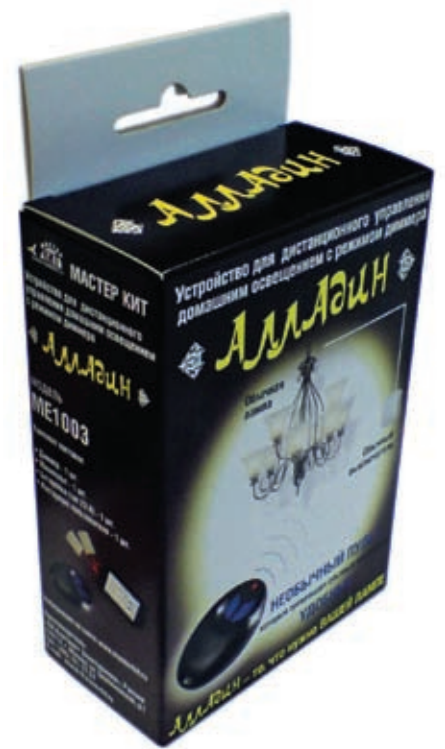
Рис. 5. Внешний вид устройства в упаковке

Богатый функционал и широкий спектр применений «Алладина» не отразился на его стоимости. Напротив: цена устройства почти вдвое ниже существующих на рынке аналогов. Так, розничная стоимость комплекта из брелка и исполнительного модуля (рис. 5) составляет около 800 рублей, а отдельно дополнительный брелок можно приобрести по цене около 400 рублей.