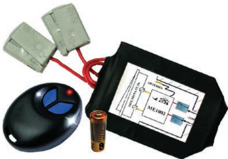
Рис. 1. Комплект «Алладин» (модель ME1003)

Радиобрелок может управлять одновременно любым количеством исполнительных устройств в радиусе действия. В свою очередь, каждое исполнительное устройство может управляться с нескольких брелков (до 32 брелков на одно исполнительное устройство). В процессе эксплуатации «Алладина» можно произвольно менять сопоставление радиобрелков и исполнительных устройств,