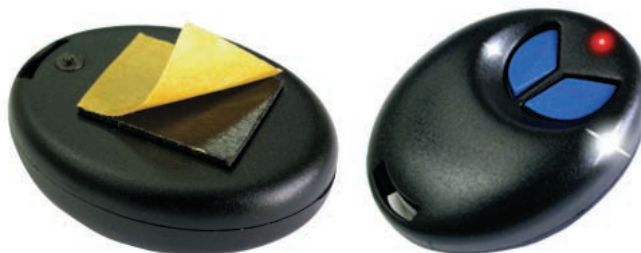
Рис. 4. Радио-брелок «Алладин» можно носить с собой или закрепить на любой поверхности

Таким образом, для использования «Алладина» в качестве средства дистанционного управления домашним освещением не имеет значения планировка квартиры, доступность выключателей или их количество. Брелок можно закрепить в удобном месте рядом с креслом или диваном и использовать в качестве резервного выключателя. А можно назначить для управления освещением несколько брелков и раздать их каждому члену семьи. Например, можно использовать радио-брелок «Алладина» непосредственно в качестве брелка для ключей, и включать свет в