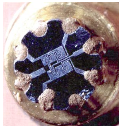
Рис. 1. RS-триггер семейства Micrologic, 1960 год (увеличение)

SIGNETICS стала первой компанией электронной отрасли, избежавшей этапа производства дискретных полупроводниковых приборов — она сразу приступила к производству ИС. Уже в 1962 году на конференции IRE в Нью-Йорке компания представила вентиль «И-НЕ» на DTL (диодно-транзисторная логика) стоимостью $125. В 1963 году американские военные начали модернизацию ракетной системы Minuteman, и одним из направлений стало широкое